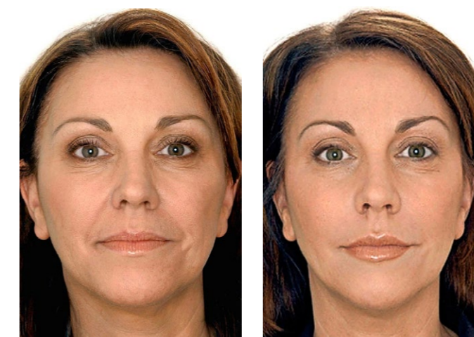
Vor dem Liquid Facelift Leicht erschlaffte Partien um den Mund und bei den Augen.

Das Liquid Facelift ist eine Alternative zu einem chirurgischen Facelifting, wenn der Alterungsprozess noch nicht so weit fortgeschritten ist. Im Internet unter «Liquid Facelift» findet man viele Texte und Adressen zum Thema.